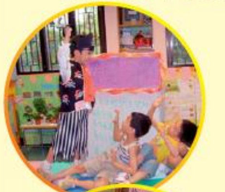
課程設計 / 編排